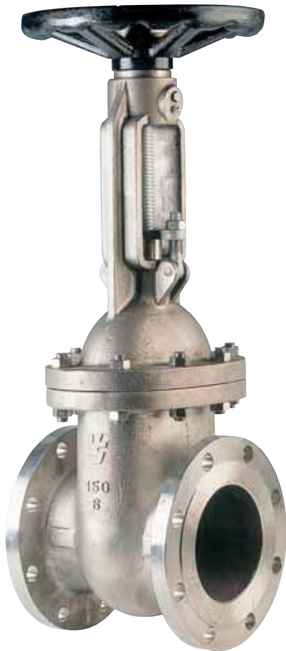
Fig. VS 132 SERIE 150 Lbs